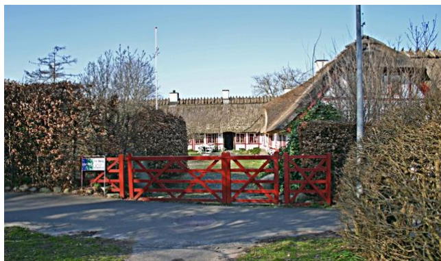
'Egegården' blev udflyttet fra Lundtofte landsby sidst i 1700 tallet

På Islandsvej ligger den stråttækte 3-længede bindingsværkgård 'Egegården', som har ligget her siden slutningen af 1700-tallet. De nuværende bygninger er fra 1833. De rummer i dag 3 enkeltboliger. Gården udgør et vigtigt kulturminde og fokuspunkt for området.