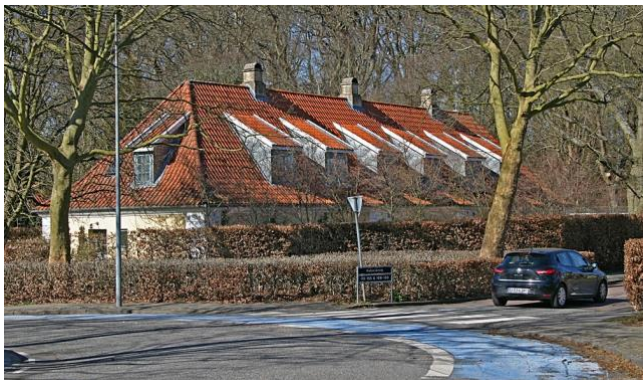
'Teglværkshuset' fra 1903 - ved rundkørslen på Kulsviervej

På Trydesvej blev der ligeledes opført arbejderboliger og en købmandsbutik i perioden mellem 1877 og 1902. Også Grønlandsvej blev bebygget i denne periode. De ældste huse her er fra starten af 1900-tallet i 1½ etage og med høj kælder.