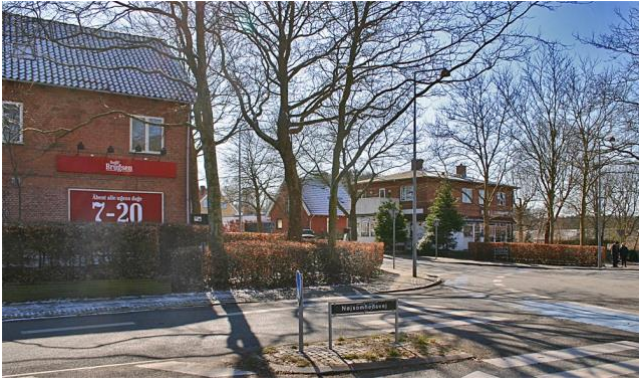
Ved rundkørslen ligger Ørholm Brugs fra 1936 og en bygning med 2 små restauranter