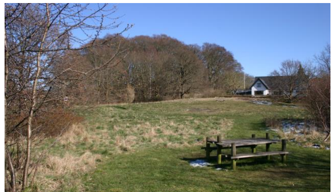
Runde Bakke set fra Nymøllevej