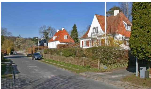
Funktionærboliger på Islandsvej – opført i 1920'erne