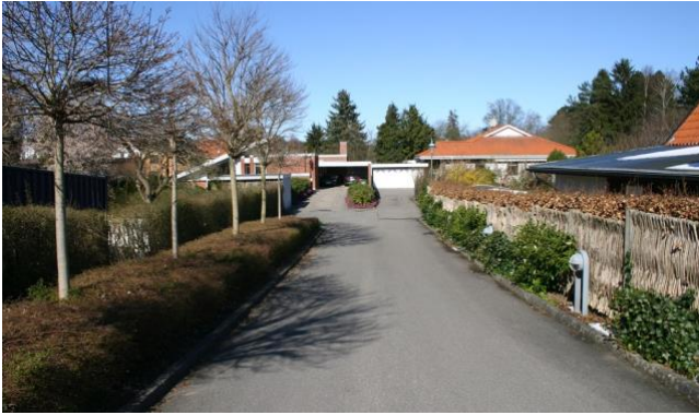
Huse på koteletgrunde langs Nøjsomhedsvej