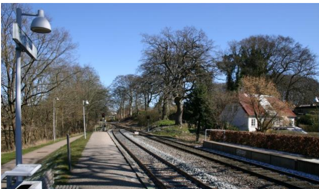
Høje træer langs Nærumbanen ud mod Mølleå dalen

De skovklædte højdedrag mod nord (Ravnholm skov) og syd (Troldehøj, Trydes Krat og Brede Krat) og mod vest (Indelukket Skov) samt kvarterets høje gamle træbevoksninger på Runde Bakke og langs skråningerne ud mod Nærumbanen udgør markante rumdannende rammer, som opleves hen over havetræer og hustage i hele kvarteret. Set fra de rekreative arealer ved Ørholm station og hovedstien langs Nærumbanen kan rækken af markante, høje ege- og bøgetræer langs skræntoverkanten opleves foran husrækken, som en kobling mellem bebyggelsen og det omgivende landskab der skaber skalamæssig sammenhæng og naturpræg i Mølleå dalen.