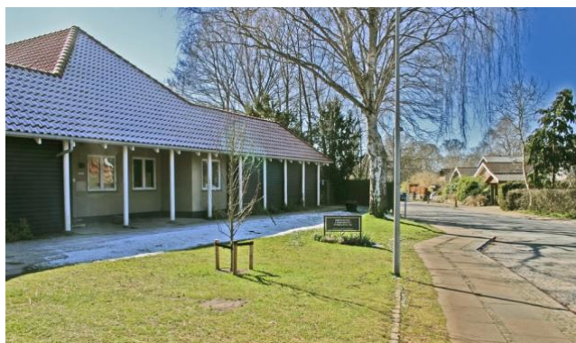
Børnehaven 'Lærkereden' på Nymøllevej – fra 1948

På Islandsvej opførtes i 1920'erne 5 store, næsten ens huse i klassicistisk stil med 1½ etage, høj kælder, hvidpudsede mure, kviste og røde tegltag. De blev bygget til funktionærer (bl.a. en garvermester og en maskinmester) på Ravnholm Papirfabrik. Husene fremtræder i dag - med deres små palærunder - som en helhed i kvarteret og er bevaringsværdige (værdi 3).