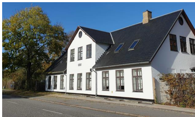
Den gamle gård 'Lille Ørholm' – udflyttet til Nøjsomhedsvej sidst i 1700 tallet

Den gamle gård har ligget her siden 1700-tallet. Den blev opført i 1833 og anvendes som børneinstitution.