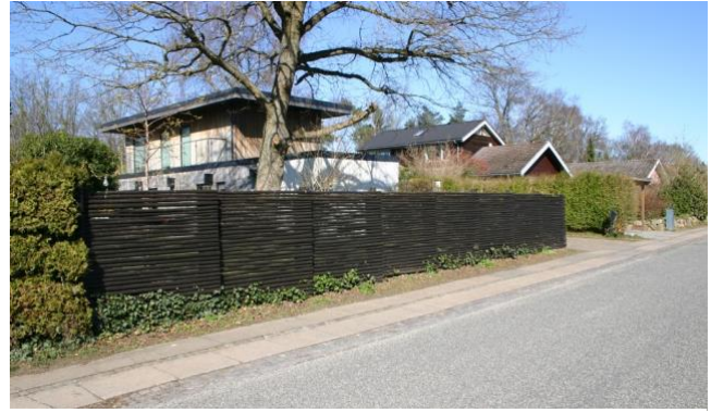
På Nymøllevej skjules udsigten mod Mølleådalen bl.a. af et parcelhus i 2 etager