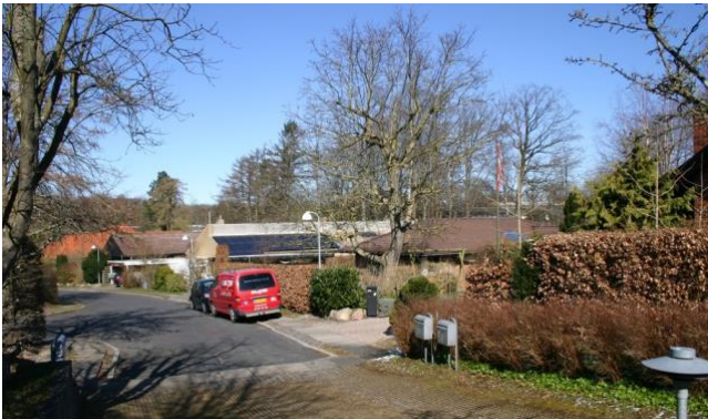
Huse på Valnøddebakken

Mange af husene er placeret på udstykninger med kuperet terræn. Ved Islandsvej, Valnøddebakken og Nøjsomhedsvej er nogle af husene opført på koteletgrunde. I andre dele af kvarteret er der dobbelthuse (især på det tæt bebyggede afsnit Valnøddebakken). På Nymøllevej findes et par enkelte 2 etages parcelhuse (stort set de eneste i Ørholm området).