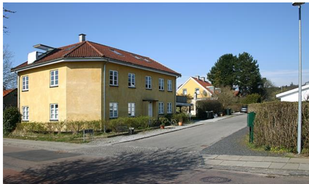
Den gamle købmand på Trydesvej – fra sidst i 1800 tallet