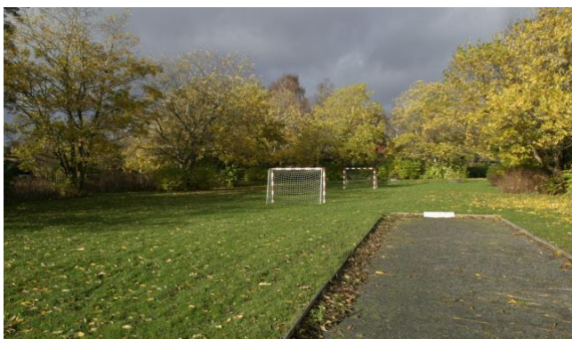
Fodboldmål og boulebane i Egegårdsparken

Egegårdsparken med dens udstrakte græsflade anvendes af kvarterets børn som boldareal og legeplads. Her er også anlagt en boulebane.