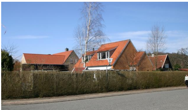
Røde tegltage ved Ørholmvej

I tidens løb er der i kvarteret sket en udvikling, hvor husene er blevet forsynet med udnyttet tagetage, tilbygninger, terrasser, carporte mm. Der er ombygget i forskellige stilarter, hvilket bidrager til variation og tilføjer kvarteret en egen charme.