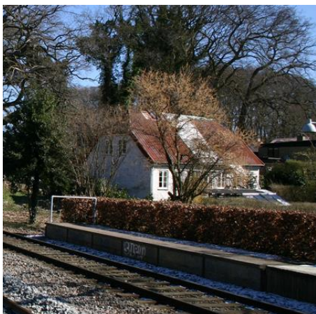
'Kildehuset' fra 1857 – ligger ved Ørholm station

Et par af Ørholms ældste huse ligger i dette afsnit. Det ene er "Møllehuset" fra år 1700 på Nymøllevej 21, som desværre ligger skjult bag et højt raftehegn. Det andet er 'Kildehuset' fra 1857, der ligger på Nymøllevej og tæt op ad Nærumbanen. Navnet tilskrives, at huset lå tæt på en kilde, hvor områdets beboere kunne hente vand til husholdningen, og heste kunne vandes.