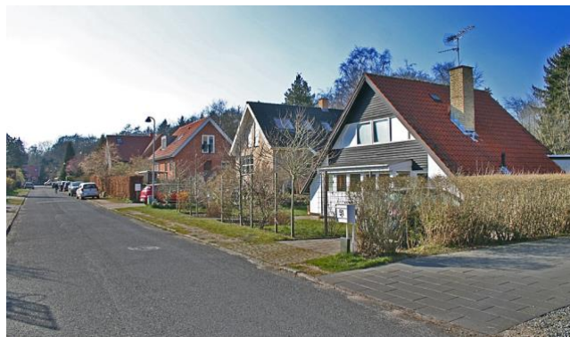
Huse på Færøvej

Et par af Ørholms ældste huse ligger i dette afsnit. Det ene er "Møllehuset" fra år 1700 på Nymøllevej 21, som desværre ligger skjult bag et højt raftehegn. Det andet er 'Kildehuset' fra 1857, der ligger på Nymøllevej og tæt op ad Nærumbanen. Navnet tilskrives, at huset lå tæt på en kilde, hvor områdets beboere kunne hente vand til husholdningen, og heste kunne vandes.