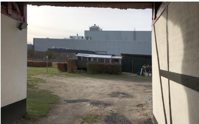
Der er en grel kontrast mellem landsbymiljøet og en høj industribygning i nabokvarteret – et kig gennem Sognefogedgård's ladeport.

Den høje nyere industribygning (Nymøllevej 78, opført 1969 og 2003) vest for Sognefogedgård, i randen af landsbykvarteret, virker dominerende og forstyrrer oplevelsen af områdets proportioner og landlige præg. Dette skyldes, udover bygningernes højde og omfang, at der ikke, som ved Lundtofte-området, er etableret en afskærmende randbevoksning.