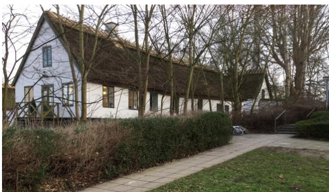
Stuehuset til den 4-længede 'Bjælkeagergård' (1890) på Lundtoftevej.