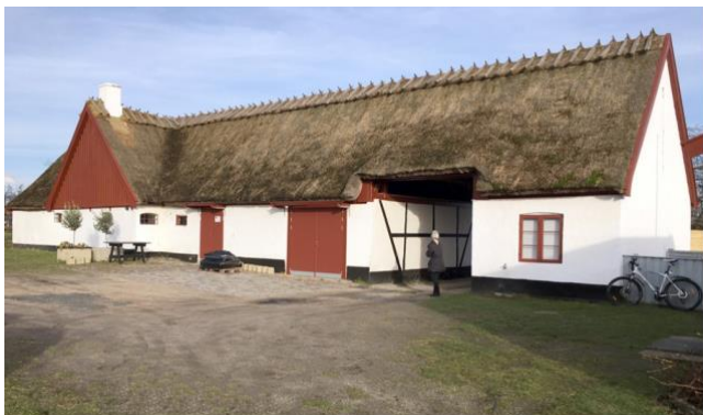
'Sognefogedgårds' lade fra 1837.

Landsbyens ældste bygning er laden på Ravnholmvej 25, som hørte til Sognefogedgård. Ud over rester af Sognefogedgård findes der i dag 4 bøndergårde i kvarteret: Søgården, Rævehøjgård, Bjælkeagergård og Lundtoftegård.