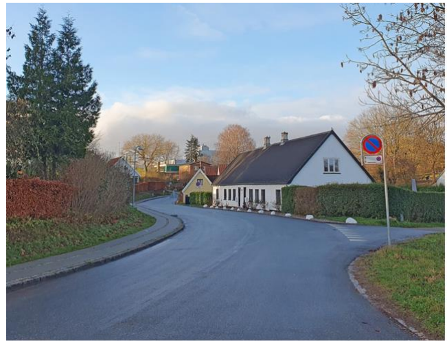
Landsbygaden 'Ravnholmvej' med gamle landsbyhuse (gadehuse).