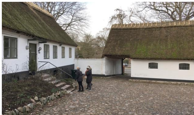
Gårdspladsen til 'Rævehøjgård'.