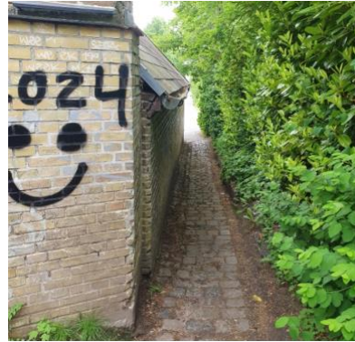
'Smøgen' er en del af Lundtofte Skolestræde og løber mellem keramikhuset og Købmandsgårdens haveareal.