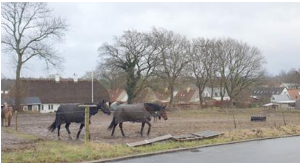
Hestene i foldene ved Ravnholmvej og Nymøllevej indgår naturligt i landsbymiljøet.

Der går heste i foldene langs Ravnholmvej og Nymøllevej. Lundtofte Ridecenter på Søgården har både stalde og en mindre ridebane i området, og de har heste på græs på græsarealerne øst for Nymøllevej.