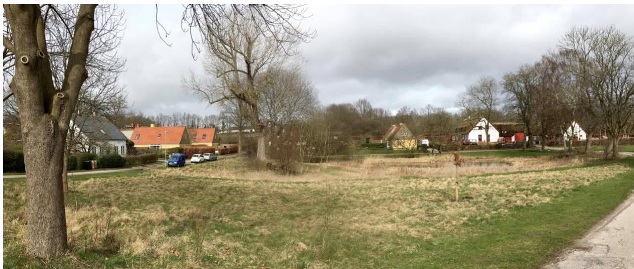
Landsbyens fælled med gadekæret. I baggrunden nyere dobbelthuse (tv) og Søgårdens hvide gavle.

Bebyggelsestype: Gårde, lænehuse, parcelhuse, 1-1½ etage, gamle skolebygninger