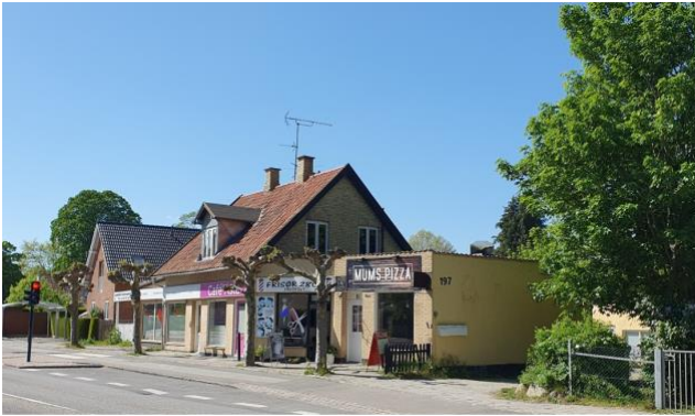
Gadehus fra 1893 med fire lave ahorntræer foran. Oprindeligt landsbyens slagteri, i dag småerhverv – autoværksted, frisør, yoga-studie og pizzeria.