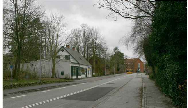
Det lille hvide hus på Lundtoftevej 212 (fra 1892) var købmandshandel gennem 100 år.

Der er en ny udvikling af kvarteret undervejs, som udgør en trussel mod landsbymiljøet. Kommunen besluttede i 2024, at der indenfor de næste 5-6 år skal opføres en meget stor børneinstitution ('Børnelandsby') på arealerne omkring de to gamle skolebygninger. Begge de gamle skolebygninger og keramikværkstedet skal også indgå i 'Børnelandsbyen'.