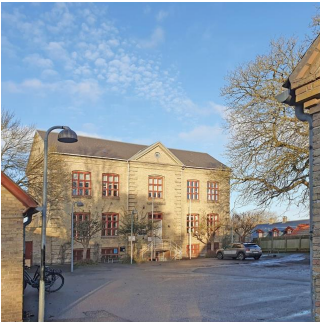
Kommuneskolen fra 1904 - medborgerhus gennem 40 år.

Vest for Ravnholmvej ligger Lundtoftes første landsbyskole, en lav bygning fra 1872. Kommuneskolen kommer til i 1904 og får tilbygget gymnastiksal i 1927. Den er opført i 2 ½ etager i gult murværk og med røde vinduesindfatninger. Sidehuset mod vest er opført samme år og rummede vaskehus med kedel og komfur, samt brændeskure. I 1985 blev det indrettet til keramikværksted.