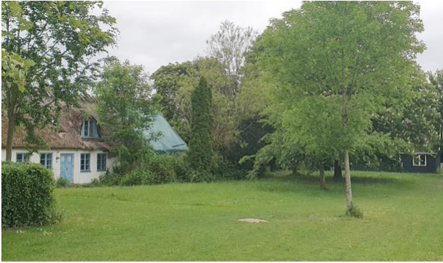
En uforstyrret have med store træer og græsplæne ligger ved 'Kibenichs hus'.