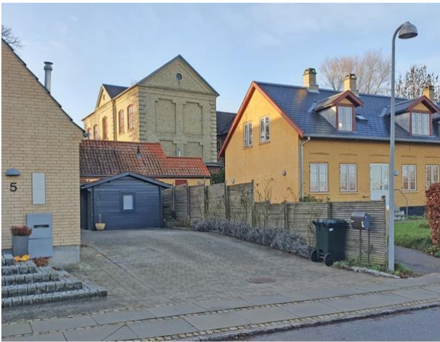
Den gamle kommuneskole (1904) flankeret af et moderne længehus og et gammelt landsbyhus med arbejderboliger (1881) på Ravnholmvej.

Den ældste skolebygning fra 1872 har været skolefritidsklub siden 1977, men klubben blev i 2023 flyttet over på den nyrenoverede Lundtofte skole. I stedet anvendes bygningen nu som børneinstitution.