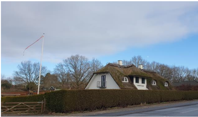
Lundtoftegård på Lundtoftevej (genopbygget efter brand i 2003)

I 2013 nedbrændte Østergård næsten totalt. Den er nu (2024) under genopbygning i oprindelig stil, men har fået tegltag i stedet for stråtag.