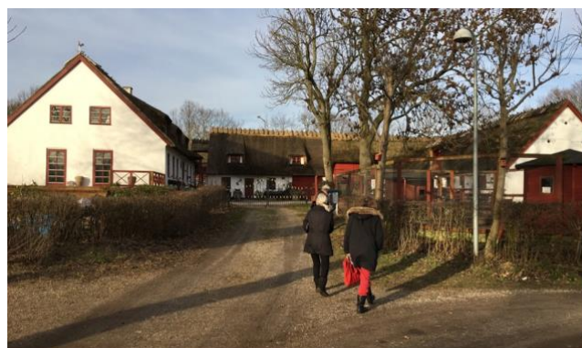
Den 3-længede 'Søgård' (1848 og 1888) åbner sig ud mod landsbyens fælled.