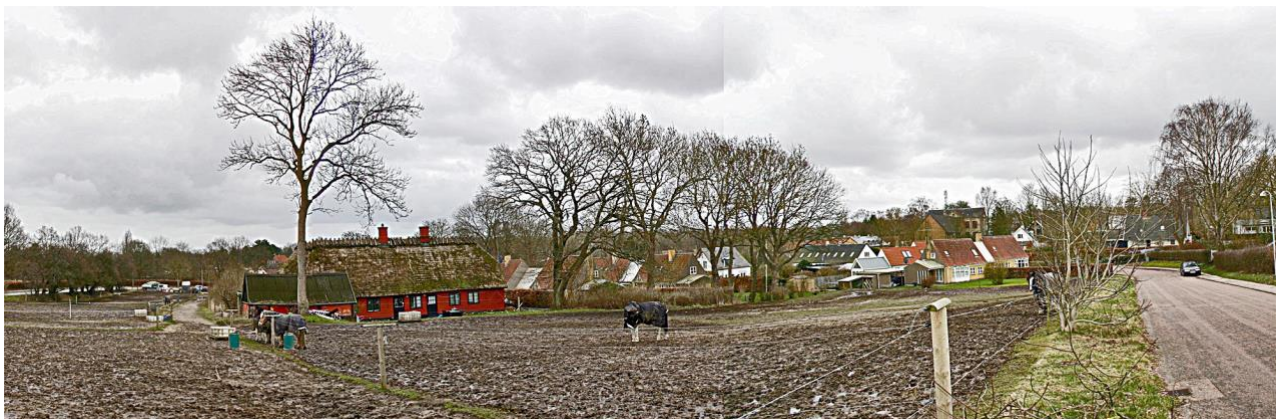
Landsbyens helhed, gårde og huse med omgivende marker og hestefolde. Kommuneskolen kan skimtes bagerst over landsbyhusene. Set en vinterdag fra Ravnholmvej ved Sognefogedgård.

Lundtofte landsby fremtræder med sin åbne grønne fælled og gadekæret samt de historisk repræsentative bebyggelser af gårde, gadehuse og skolebygninger som et karakteristisk kulturmiljø, der opleves som sådan både udefra de omgivende veje og inde fra området.