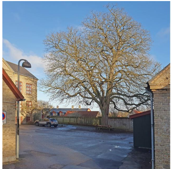
Skolegården med det ikoniske kastanjetræ. I baggrunden ses landsbyhus på Ravnholmvej 7-9.

Den gamle kommuneskole fra 1904 har gennem 40 år (1982- 2023) fungeret som medborgerhus. Det var mødested og aktivitetscenter for Lundtofte-området, Hjortekær og andre dele af Lyngby og dækkede mange lokale fritidsbehov. Medborgerhuset var åbent både dag og aften og gav dermed bl.a. pensionister mulighed for aktiviteter i dagtimerne.