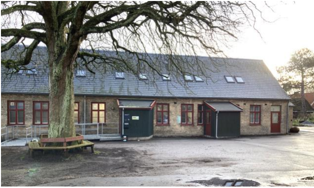
Landsbyskolen fra 1872

Den ældste skolebygning fra 1872 har været skolefritidsklub siden 1977, men klubben blev i 2023 flyttet over på den nyrenoverede Lundtofte skole. I stedet anvendes bygningen nu som børneinstitution.